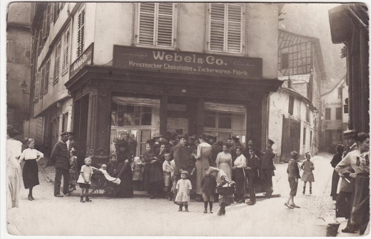
Schokoladen- und Zuckerwarenfabrik in Bad Kreuznach um 1926

Nach der sogenannten Reichskristallnacht vom 9. auf den 10. November 1938, in der in der Schokoladenfabrik der Familie „viele große Gläser mit Essenzen“ zerschlagen wurden, „ebenso wie alle Fenster“ und alles im Wohnhaus zerstört wurde, „alle die wertvollen Meissen-Figuren, die mein Vater gesammelt hatte, alles Porzellan, Tafelgeschirr, Kristall, Gläser und was noch vernichtet werden konnte“ (...), hatten, wie Hesdörffer schreibt, „alle nur noch den einen Gedanken: Fort von hier [...]“. (M., S. 17)