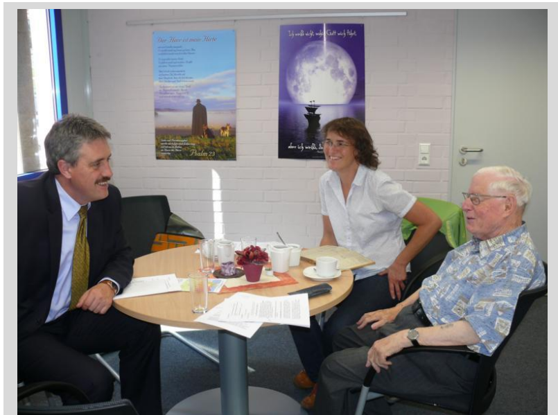
Vorbereitungstreffen für die Gründung des Vereins „Bildungswerk Heinz Hesdörffer e.V.“ in Bad Kreuznach im Dietrich Bonhoeffer Haus am 01.09.2011.