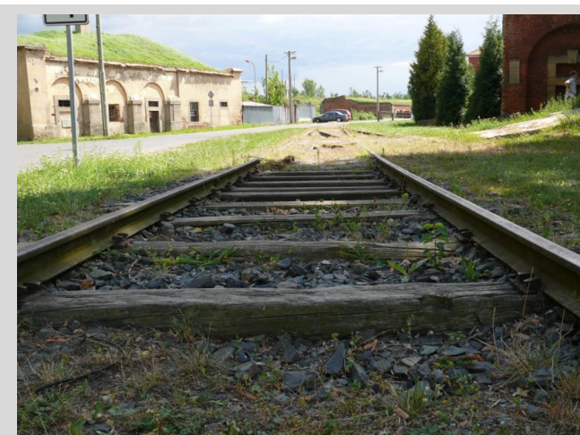
Rampe in Theresienstadt