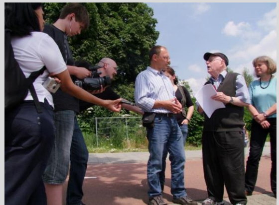
Filmaufnahmen in Arnhem

Am 2. März 1943 werden die drei Freunde um halb 12 Uhr nachts aus dem Schlaf gerissen und zu einem Überfallwagen eskortiert. In der eintretenden Wartezeit auf der Straße gelingt es den Dreien, in einen nahen Hauseingang zu fliehen. Hesdörffer stellt sich kurzfristig bei einer