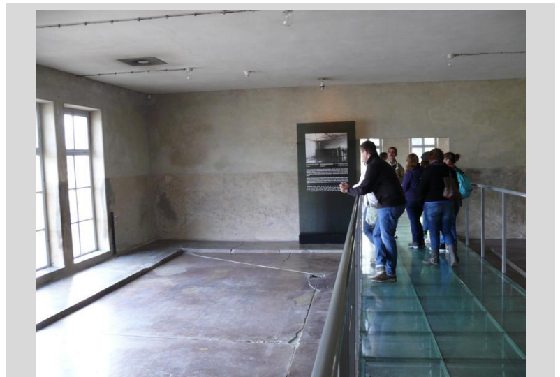
Duschraum in der „Sauna“ in Birkenau.