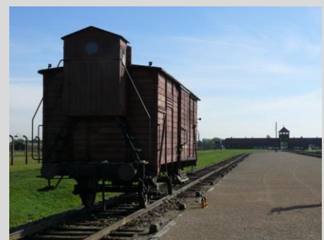
Viehwagen in Auschwitz-Birkenau